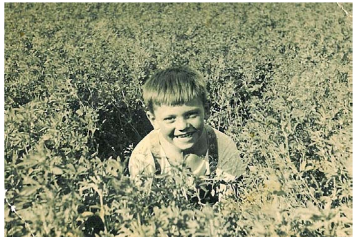
Fritz Portrait und im Garten