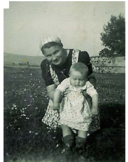
Mutter mit Helmut, rechts Hofmauer von Hausenblas, links liegt der Anger